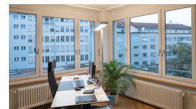
SAKK, Bern 2016