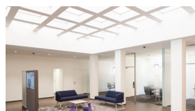
Bank, Bern 2016