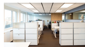
PKRück, Zürich 2016