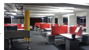
Schweizerische Post, Call Center, Fribourg 2006