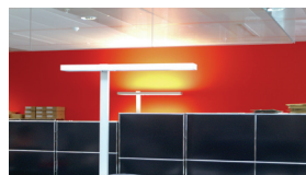
Allianz Suisse, Genf 2010