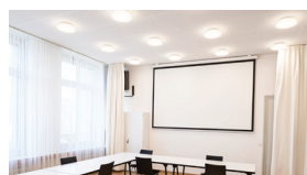
Musikschule, Zürich 2015