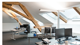
Meteotest, Bern 2014