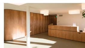
Alters- und Pflegezentrum, Wattenwil 2016